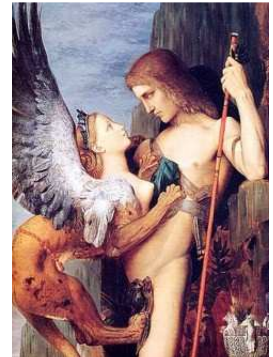
G. Moreau, Edipo e la Sfinge (part.)

Sette lezioni sulle differenze energetiche di genere