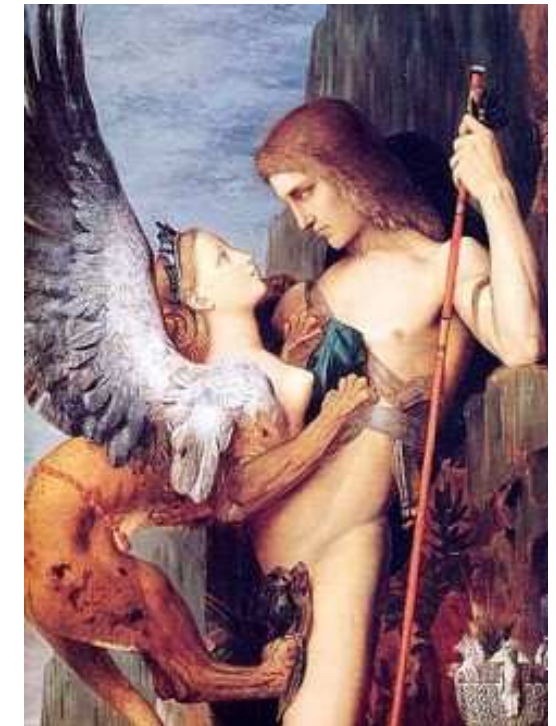
G. Moreau, Edipo e la Sfinge (part.)

Via A. Manzoni, 20 36021 VILLAGA (VI) www.ilcrogiuolo.net e-mail: info@ilcrogiuolo.net Tel. 0444 868422